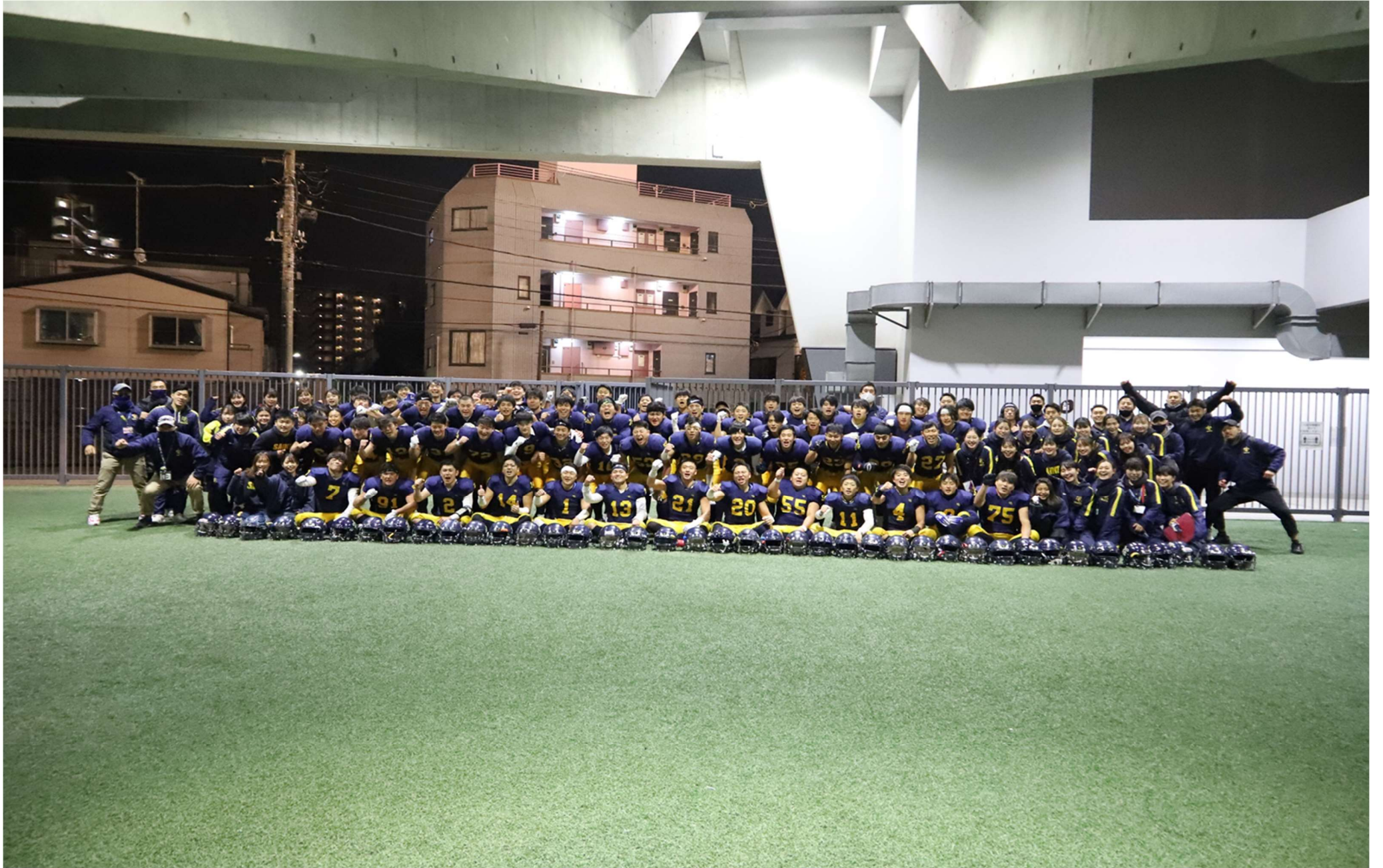
ALL SAINTS 集合写真